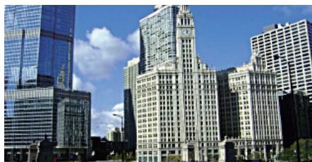
< 정상인 시야 >

원은 180여 명에 불과한데, 이러한 전문의 2명을 보유한 병원은 전국적으로 많지가 않다. 또한 백내장, 각막, 망막, 성형안과 등 안과 각 분야를 비롯해 내과, 마취과 전문의가 상주하고 있다. 이를 통해 환자의 종합적인 눈 상태를 파악해 정확한 진단과 개인별 맞춤 치료가 가능하다. 녹내장 진단을 위한 검사와 시기능 유지에 필요한 치료에는 대학병원에 버금가는 첨단장비를 이용한다. 대표적인 장비는 시신경 및 망막을 정밀 분석하는 빛간섭단층촬영기(OCT), 녹내장의 진행 정도를 측정하는 자동시야검사기(Humphrey Visual HFA3), 초기 녹내장 발견에 효과적인 시야검사기(FDT)와 주변조직을 손상시키지 않고 시신경 섬유주만 자극해 안압을 낮추는 선택적 레이저 섬유주성형술 장비(SLT Laser) 등이 있다. 대학병원급의 의료진과 첨단 장비를 갖추고 있지만 진료 절차는 간단하다. 새빛안과병원에서는 검사, 진단, 치료가 당일에 모두 가능하다. 응급 수술이 필요하면 당일 진행하는 경우도 있다. 치료 비용에 있어서도 본인부담금이 대학병원보다 저렴하다.