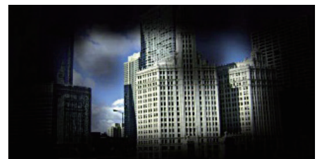
< 녹내장 환자 시야 >